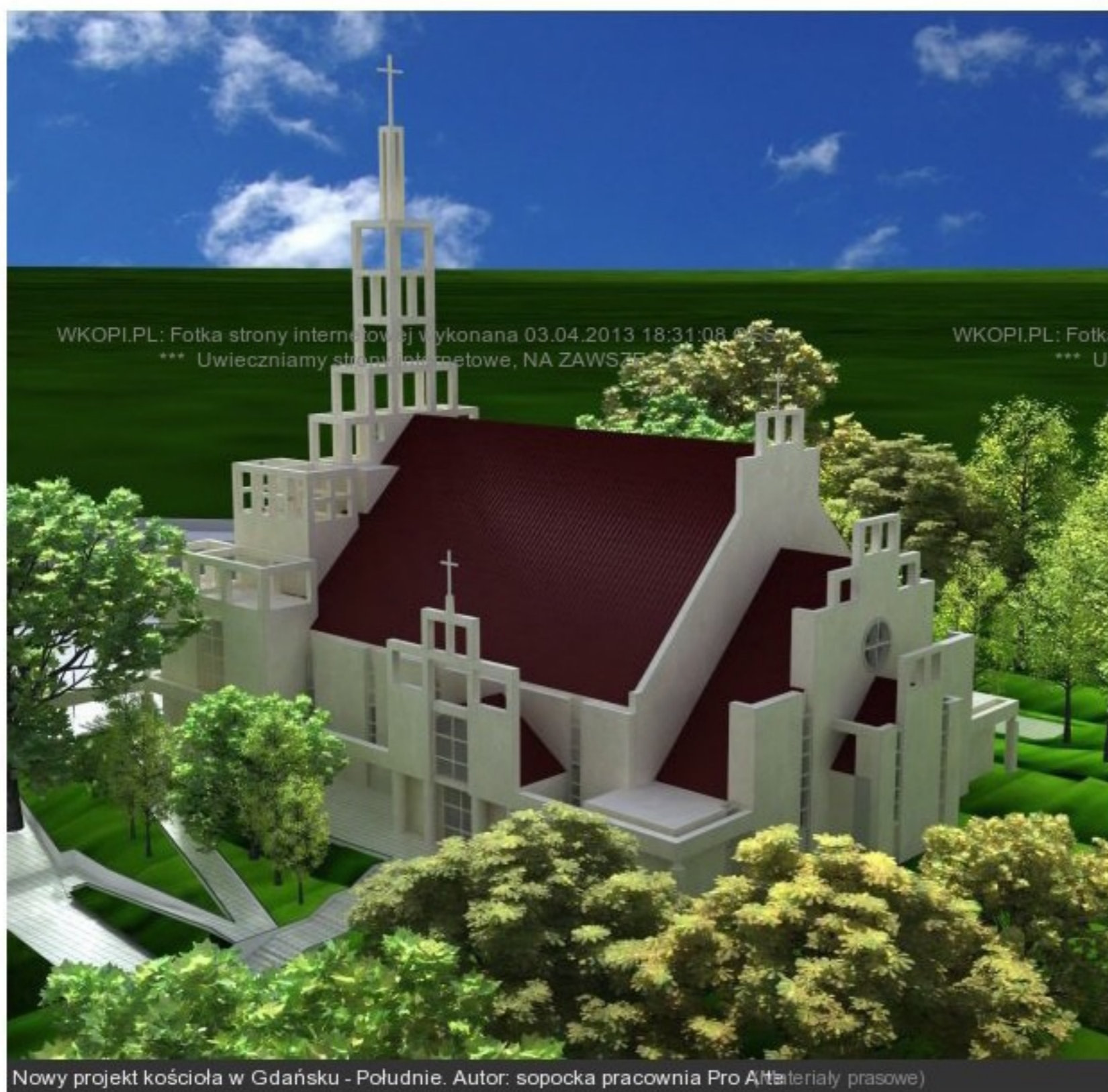
Nowy projekt kościoła w Gdańsku - Południe. Autor: sopocka pracownia Pro Arte (materiały prasowe)